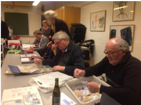
Uha, hvor der hygges!

Vi begyndte 2019 den 9. januar, hvor vi 17 var medlemmer. Det blev en rigtig hyggelig aften med virkelig god stemning.