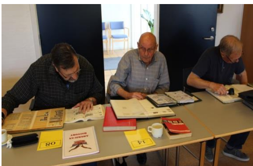
Koncentration om USA samleriet! 😊

Vi fik også et nyt medlem denne aften. 😊 Et virkelig godt møde.