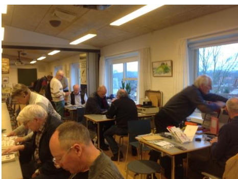
Byttedag 3. februar i Sognehuset

Vi afsluttede med kaffe og kage. Det blev en rigtig hyggelig aften.