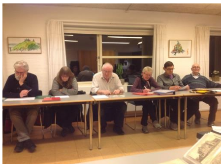
Genfs. 2019. Lytter de, eller keder de sig? ;-)