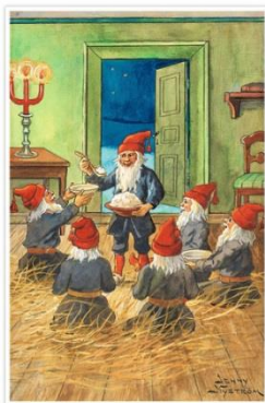
Julepostkort af Jenny Nystrøm.

Efter Coronapausen startede vi 2. halvår 2021 med Generalforsamling, den 8. september 2021. Referatet fra Generalforsamlingen kan læses på klubbens hjemmeside på siden med Bestyrelsen.