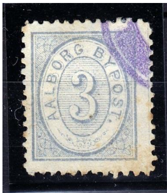
Sjælden Aalborg Bypostmærke.

Vi var 13 den 20. oktober. Der var 13 lots til salg, hvoraf 5 blev solgt.