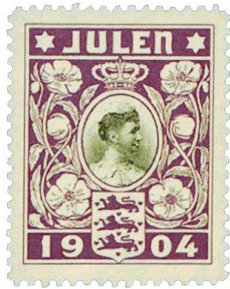
Danmarks første julemærke.