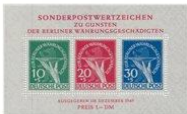
Sjælden blok.. ;-)

Den 9. marts lød programmet på "Alt tysk, postkort og frimærker".