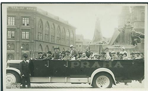
Turisttur i Prague. ☺