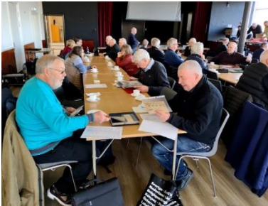
Frimærketræf i Lunden.

Vi var 8 fra Ry, der var til Midtjysk frimærketræf i Silkeborg den 27. februar sammen med klubberne i Odder, Skanderborg. Klubberne i Herning og Viborg var også inviteret.